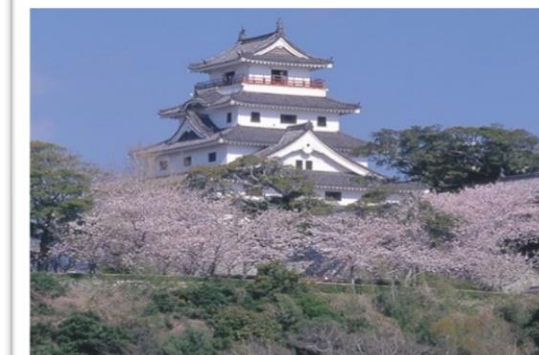
左から 鏡山からの眺望・虹の松原・唐津城 (写真はイメージです)