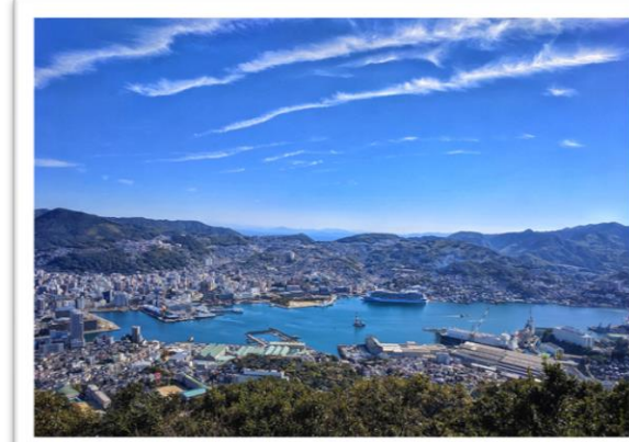
左から 軍艦島・大村湾・長崎市内