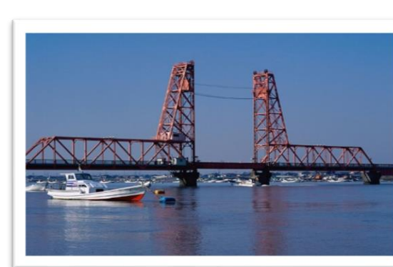
左から 有明海・金立公園・昇開橋 (写真はイメージです)