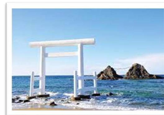
左から 糸島・姉子の浜・芥屋の大門・桜井二見ヶ浦 (写真はイメージです)